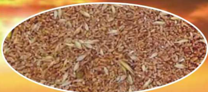
Seme dalla produzione di campo

TI SEGUE IN TUTTE LE SUE FASI: DOPO LA RACCOLTA, NELLA PULIZIA, NELLA SELEZIONE, E NELLA CONCIA!