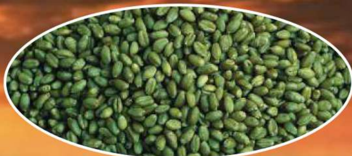
Seme trattato pronto per la semina